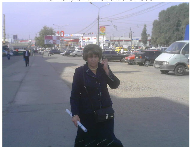
Kharkov, le 24 novembre 2006