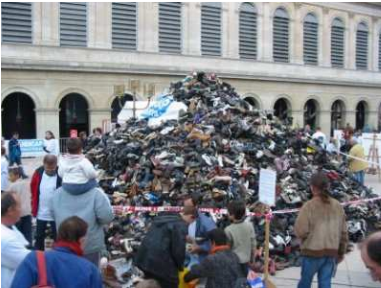
Pyramide de Lyon

La mobilisation de cette ONG était encore et toujours, contre les bombes à sous munitions (BASM) : ce sont des mini bombes larguées dans des containers par voie aérienne dont 5 à 30% n'explorent pas au premier impact et se transforment de fait en mines anti-personnel.