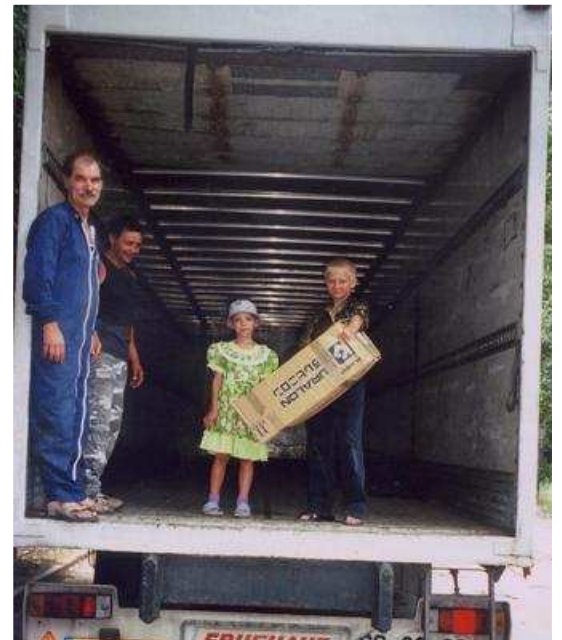
C'est terminé !