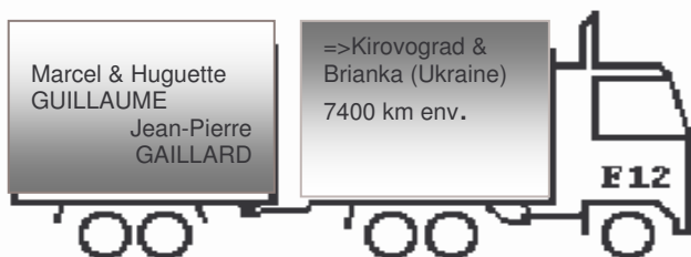
Zinaïda Interprète pour Brianka