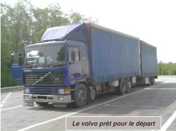
Le volvo prêt pour le départ

Eh oui ! C'est bien reparti avec la grâce de notre Dieu pour nos convoyeurs, car nos équipes de tri, elles, n'ont pas chômé l'hiver dernier et ce printemps et ce sont plusieurs milliers de cartons qui attendent, prêts à l'embarquement ! Mais notons aussi qu'une quantité non moins importante est encore en attente de tri !