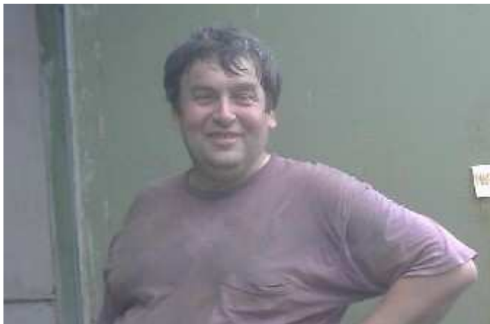
Déchargement à Brianka