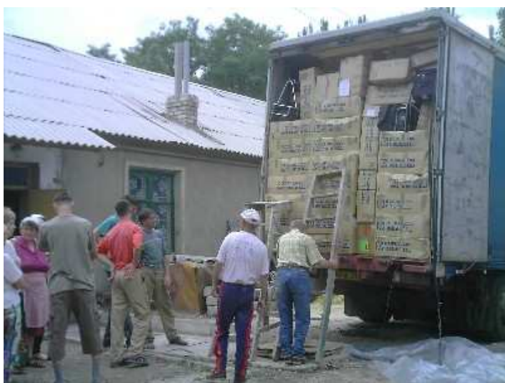
Déchargement de la remorque à Kirovograd